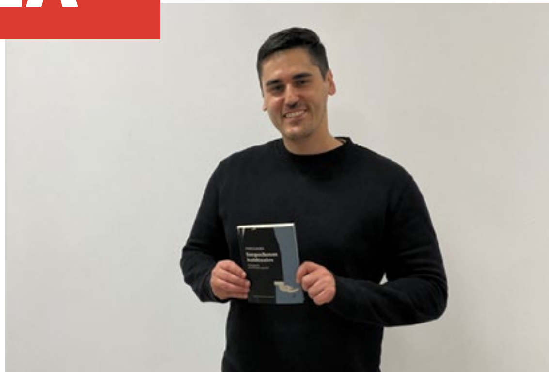
ED. TIGRE DE PAPER

Jo sóc autònom; a mi com no em poden fer fora de gairebé enlloc! Jo vaig on puc, com puc. De moment no han censurat els meus llibres. Veurem en un futur si segueix la deriva restrictiva. Però és veritat que censurar un llibre, per exemple, pot ser un efecte boomerang que al final li donaria més repercussió. I al final jo crec que per això no ho fan.