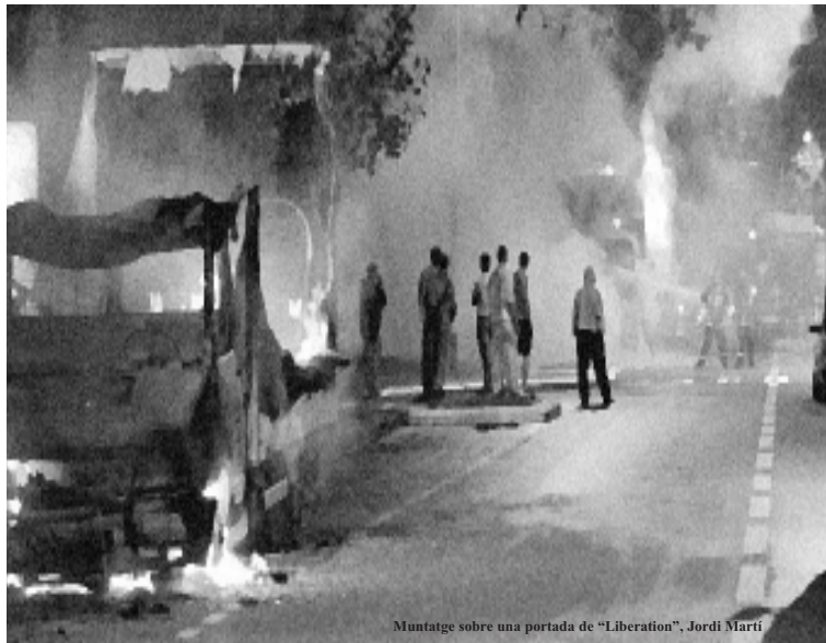
Muntatge sobre una portada de "Liberation", Jordi Martí

Entre els barris de moltes ciutats franceses crema-ven en les nits de novembre, els periodistes mediàtics catalans es miraven amb més desconfiança de l'acostumada els carrers dels barris de les nostres ciutats buscant els rastres i els senyals que anunciessin que aquí el contagi havia arribat. Que havia arribat o que arribaria més aviat o més tard, com si es tractés d'una grip aviària. Buscaven justificar la seva teoria sobre les guspies que han fet explotar els litres de gasolina incendiats, llençats contra col·legis, cotxes, supermercats... El foc ha cremat més de vuit mil cotxes en setmanes successives, dia rere dia, i desenes d'edificis administrats per l'Estat, nit rere nit, amb un constant enfrontament entre joves i policia en què uns i altres