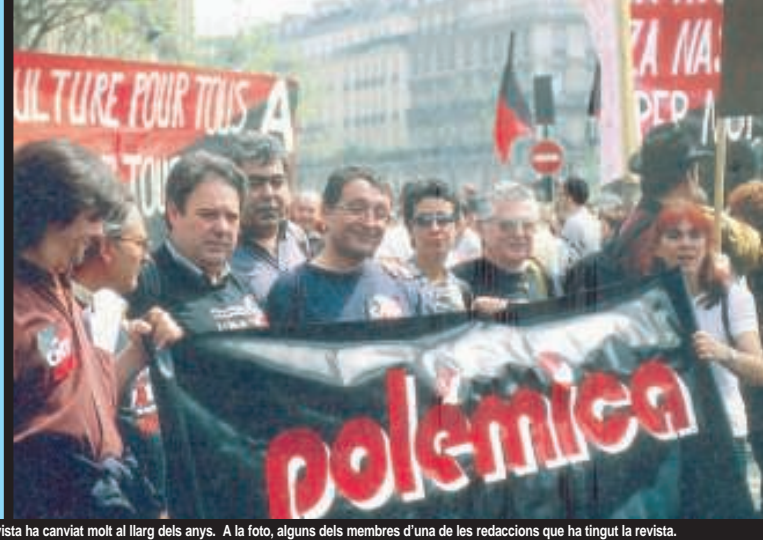
El col·lectiu editor de la revista ha canviat molt al llarg dels anys. A la foto, alguns dels membres d'una de les redaccions que ha tingut la revista.