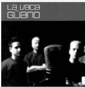
LA VACA GÜANO, "RETRATO DIFUSO"