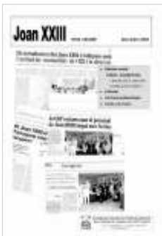
JOAN XXIII ROIG I NEGRE Butlletí de la secció sindical de CGT a l'Hospital Joan XXIII de Tarragona, c/Joaquim Mallfré 4, Tarragona, tel. 645 102 243