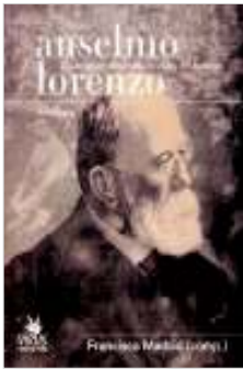
FRANCISCO MADRID (COMP.) Col·lecció Acracia, Virus Editorial