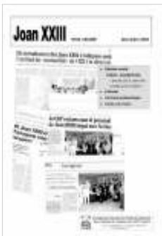
JOAN XXIII ROIG I NEGRE Butlletí de la secció sindical de CGT a l'Hospital Joan XXIII de Tarragona, c/Joaquim Mallafre 4, Tarragona, tel. 645 102 243