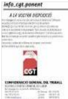
INFO_CGT_PONENT Butlletí informatiu de la Federació Intercomarcal de Lleida de la CGT, lleida@cgtcatalunya.cat www.cgtlleida.org