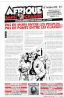
AFRIQUE SANS CHAINES Revista bimensual (en francès) del grup de treball sobre Àfrica de CNT, 33 rue des Vignoles, 75020 Paris, africa@cnt-f.org / www.cnt-f.org Catalunya. Gener de 2009