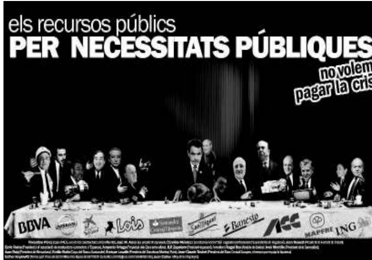
Fragment dun cartell de convocatòria als actes de l'Assemblea Popular Anticapitalista de Ponent.

La monarquia és el règim de la bancocràcia, que diria Proudon, fa cent cinquanta anys. En la bancocràcia imperant en lanomenat regne d'Espanya, les suprimeix no estan, certament, en les entitats financeres. Ja s'han encarregat aquestes, a l'hora de prestar-te un, enxampar-te tres, com demostren els molt sanejats índexs de morositat, a pesar de la crisi. Les veritables suprimeix, letalment tòxiques per a moltes economies de gent treballadora, estan en cada hipoteca sobre habitatge sobrevalorada, amb elevats interessos referenciats en la base del negoci bancari, leuorbor. Si el sistema capitalista es caracteritza per convertir els drets de la gent en negoci privat, aquesta no és una excepció: