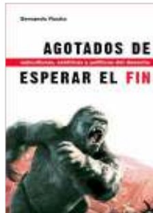
“Agotados de esperar el fin” SERVANDO ROCHA Editorial Virus

La seva mort el 1914 va deixar un profund buit entre els militants anarquistes.