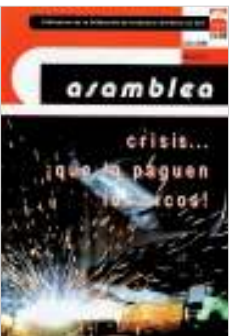
ASAMBLEA Revista de la Federació estatal de sindicats del metall, FESIM-CGT, Coso 157 local izda., 50001 Zaragoza, fesim_cgt@nodo50.org